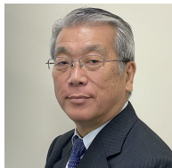
畔柳昭雄 (日本大学名誉教授)