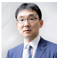
渡辺哲也 (ERIA 事務総長)